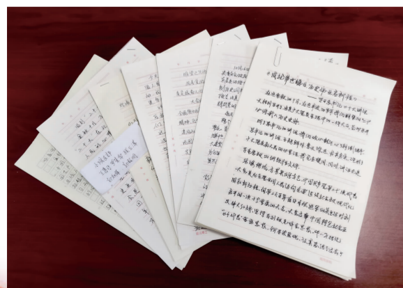
地区党员手写感悟