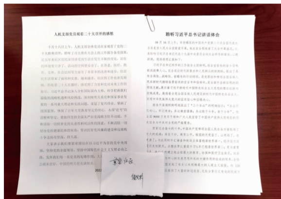
社区党支部学习感悟