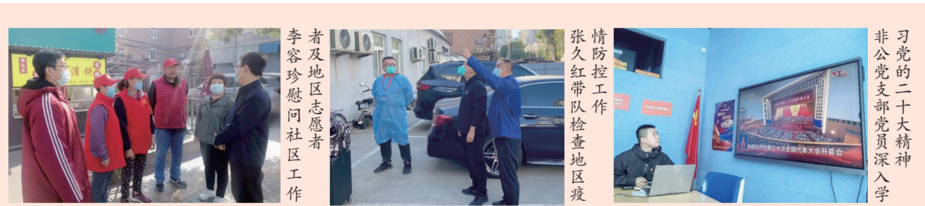
李容珍慰问社区工作者及地区志愿者