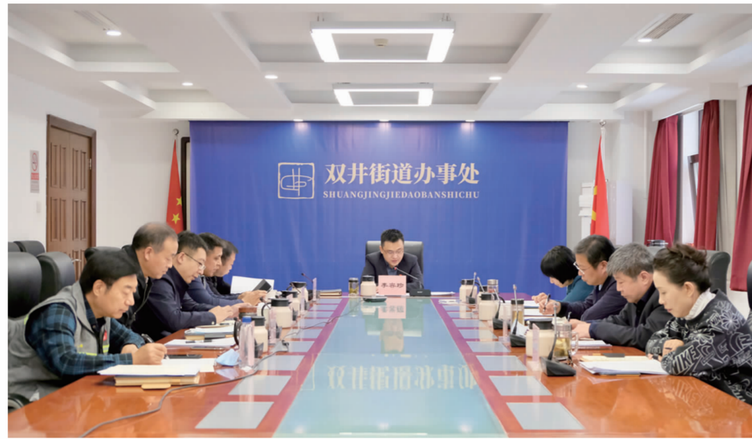
理论学习中心组学习党的二十大精神